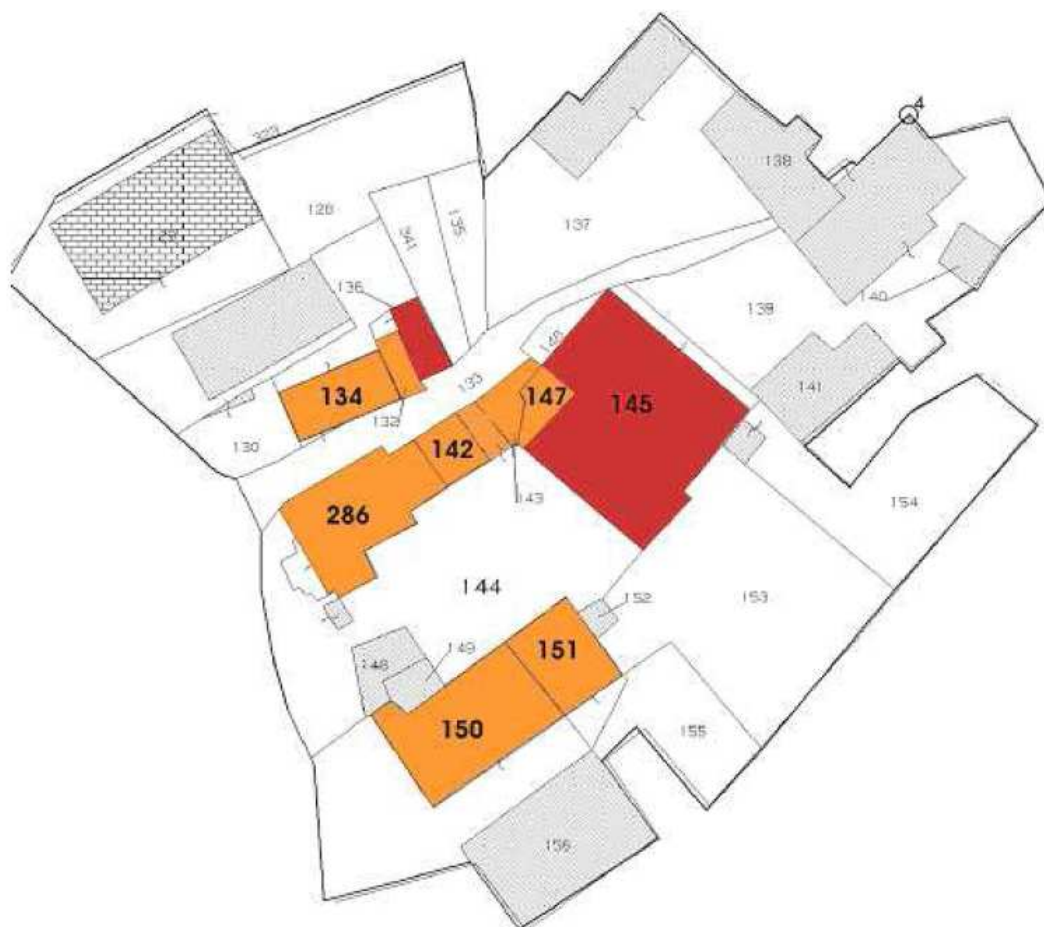
Stralcio di mappa catastale